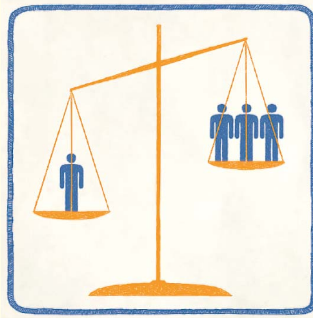
Illustraties Sebe Emmelot

Het feit dat zelfs de meest wezenlijke kerntaak van de overheid, die van de ordehandhaving, niet naar behoren wordt uitgevoerd, leidt daarnaast tot een groeiend gevoel van onbehagen onder gezagsgetrouwe burgers. Onfatsoen, rotzooi en verloedering winnen het van orde, veiligheid en gezagsgetrouwheid. De criminaliteitscijfers hebben de afgelopen dertig jaar een nadrukkelijke stijging laten zien. Veel kleine vormen van criminaliteit worden door de politie niet eens meer in behandeling genomen. Politici die, deze werkelijkheid negerend, aan de hand van de laatste kwartaalstatistieken proberen uit te leggen dat het in vergelijking